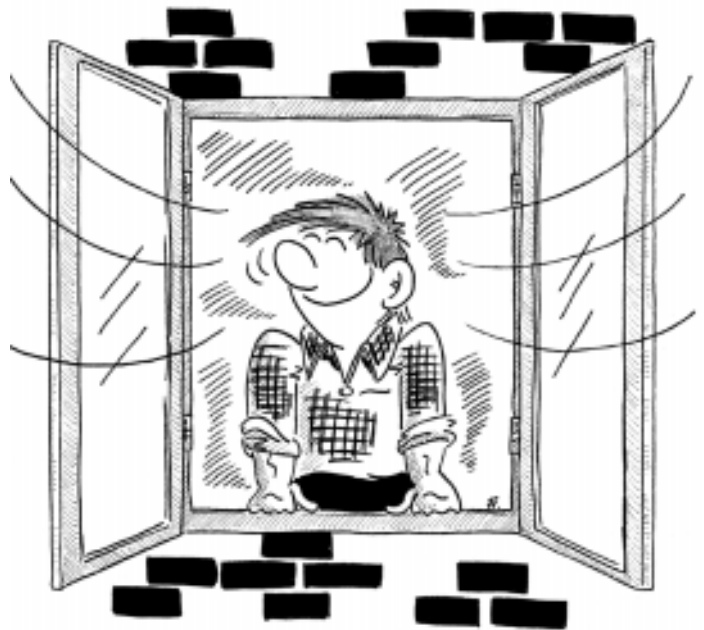
Op med vinduerne i 5-10 minutter. Ud med fugtig luft. Det gavner. Tegning: Frank Hjørhø.

En kombination af husstøvmider, bakterier og skimmelsvampe er ikke godt for helbredet. Det er ikke ual-